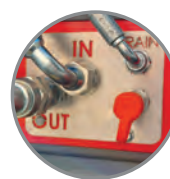
• Port pro kontrolu tlaku ve vratném vedení