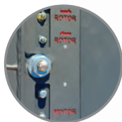
Centrální mazání •