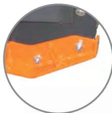
• Výměnné plazy