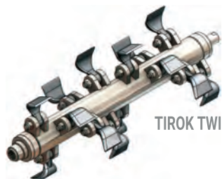
TIROK TWIN L MU