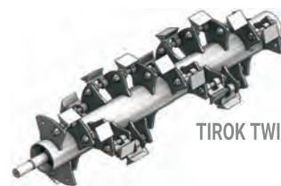
TIROK TWIN L MF