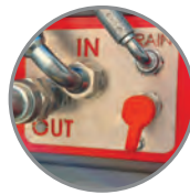
• Port pro kontrolu tlaku ve vratném vedení