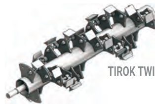
TIROK TWIN G MF