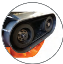
• Řemenový pohon rotoru