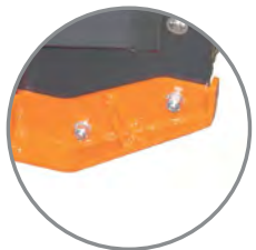
• Výměnné plazy