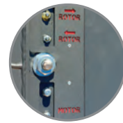
• Centrální mazání