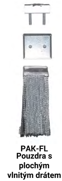
PAK-FL Pouzdra s plochým vlnitým drátem

► Pohon pracovního disku vývodovým hřídelem, další funkce ovládané hydraulicky