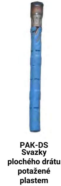
PAK-DS Svazky plochého drátu potažené plastem