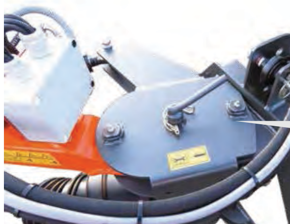
Mezikus pro prodloužení dosahu